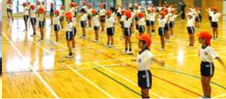
【ラジオ体操でウォーミングアップ】