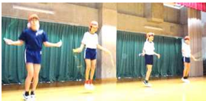
【体育委員会の見本跳び】

まだ、2月冬本番ですが、今年は日によって、寒暖の差が激しく、元気に半袖で登校する子や体調不良気味の子もいます。県内では、インフルエンザや胃腸炎も流行っているようです。ご家庭での体調管理等、ご配慮をお願いします。学校では、「寒さ吹っ飛ばせ・体力づくり」をねらいに、体育委員会を中心に短縄で楽しみました。